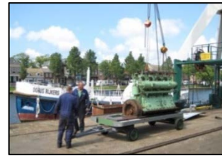
De motor wordt gelicht en naar de werkplaats vervoerd.

Vanaf 2009 is er door een groep enthousiaste liefhebbers keihard gewerkt aan het herstel van de boot. Was het oorspronkelijk niet de opzet om de motor uit de boot te halen en te reviseren in 2 e instantie werd besloten dit wel te doen. Naar later bleek een juiste beslissing. Deze was echter niet opgenomen in de begroting. Was het besluit tot reviseren van de motor niet genomen dan had de boot niet kunnen varen. De oudscheepswerktuigkundigen in het vrijwilligersteam hebben de Deutz-Brons van 1923 uit de boot gehaald, deze volledig gedemonteerd, onderdelen gereviseerd en de motor weer in elkaar gezet.