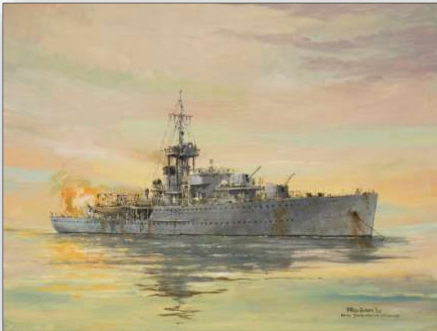
Hr.Ms. Johan Maurits van Nassau tijdens de beschieting van de Oostelijke kop van de Afsluitdijk