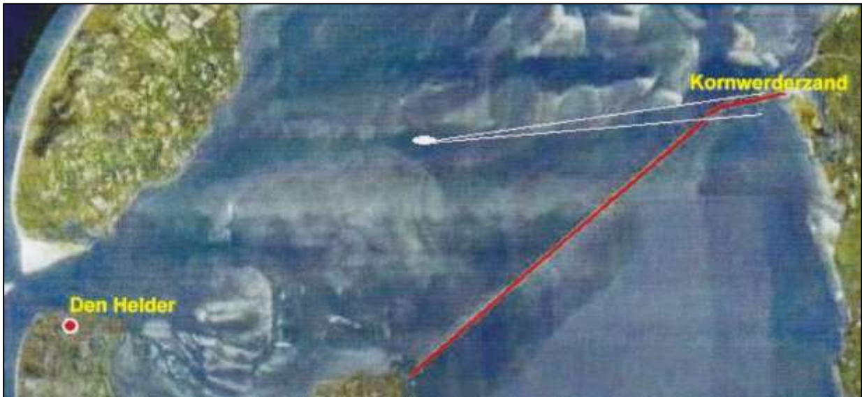
De positie van Hr.Ms. 'Johan Maurits van Nassau' ten anker in de Doove Balg)