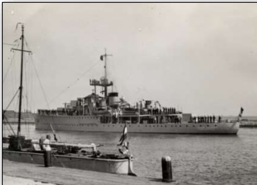
Hr.Ms. Johan Maurits van Nassau verlaat de haven van Den Helder.